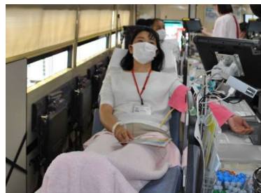
アイオー信用金庫